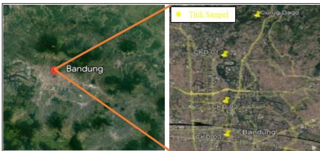
Gambar 1.1 Lokasi daerah penelitian (Supriatno, dkk., 2022)

Lokasi daerah penelitian berada di 5 lokasi berbeda di mulai dari Teras Sungai Cikapundung (CKD-01), Wastukencana (CKD-02), Braga (CKD-03), dan 2 lokasi lainnya menerus sampai hilir sekitar Kawasan Sub-DAS Cikapundung yang berada di Kota Bandung, Jawa Barat (Gambar 1.1). Sampel merupakan data sekunder yang diambil pada bulan Agustus tahun 2020.