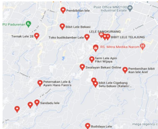
Gambar 1.1 peternakan ikan lele di sekitar setu