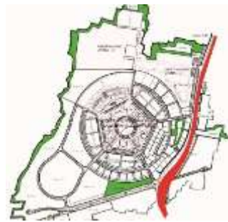
Gambar 1. 2 Peta Masterplan Kota Deltamas (Diperbesar)