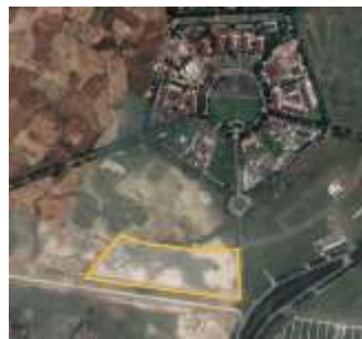
Gambar 1. 3 Peta lokasi perancangan