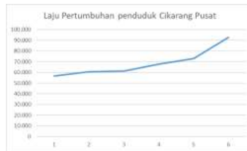
Diagram 1. 2 Pertumbuhan penduduk Cikarang pusat

Sumber: Katalog BPS 1102001.3216 (diolah kembali 2022)