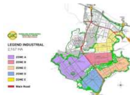
Gambar 1. 1 Peta zonasi wilayah Kota Deltamas